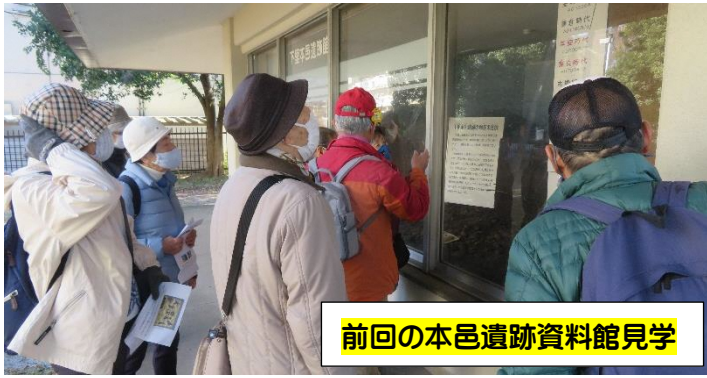
前回の本邑遺跡資料館見学