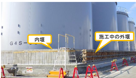
(写真2-1) タンクエリアの堰の設置状況①