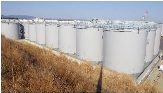
(写真1) G4南タンクエリア全景