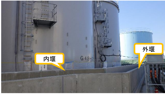
(写真 2 - 2) タンクエリアの堰の設置状況②