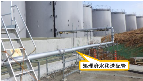
(写真 3) 処理済水移送配管の設置状況