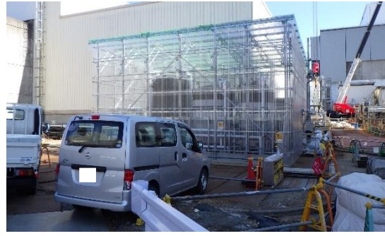
(写真1-2) 同左 今回撮影