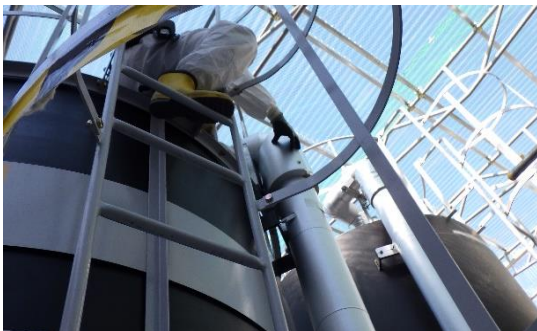
(写真2-3) ハウス内での保温材取り付け作業の 様子