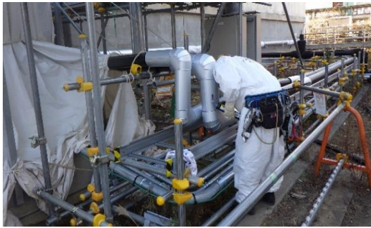
(写真2-1) サブドレン除鉄装置ハウス外部南東 側配管の敷設状況 前回(令和2年12月22日)撮影