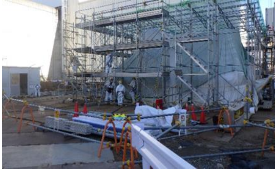
(写真1-1) サブドレン除鉄装置設置箇所外観 (南西側から撮影) 前回(令和2年12月22日)撮影