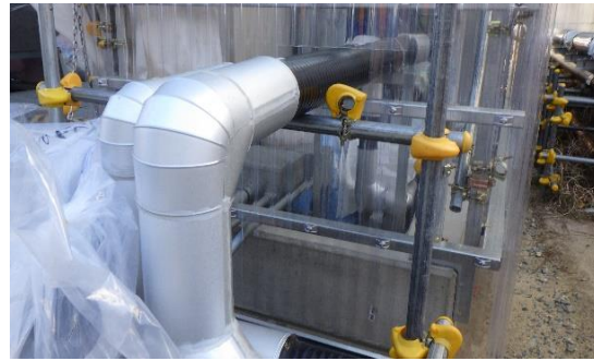
(写真2-2) 同左 コーキングが完了していた