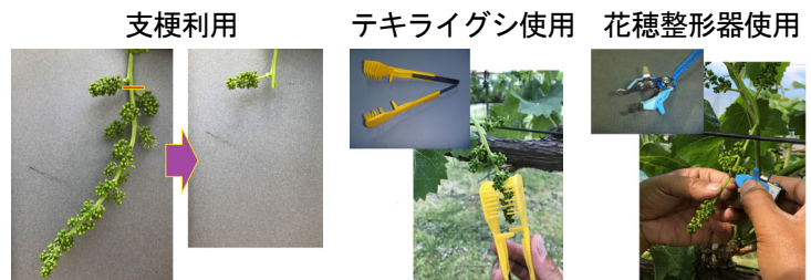
図2 「シャインマスカット」における省力的果房管理技術