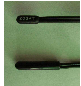
図1 樹脂製の汎用センサー