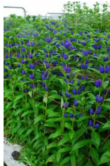
図3 草姿、生育揃いは良い