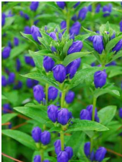
図2 開花順序は中段から。既存の品種に比べ、頂花咲きは良い。