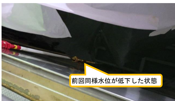
(写真3) 貯蔵プールの状況