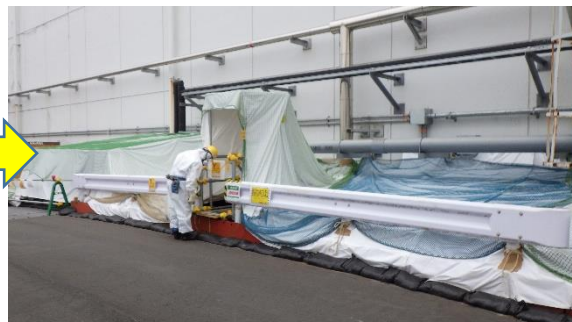
(写真4-2) 同左 (令和3年6月15日撮影)