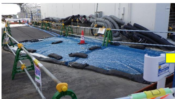
(写真5-1) サイトバンカ建屋北西側陥没箇所 (令和3年5月10日撮影)