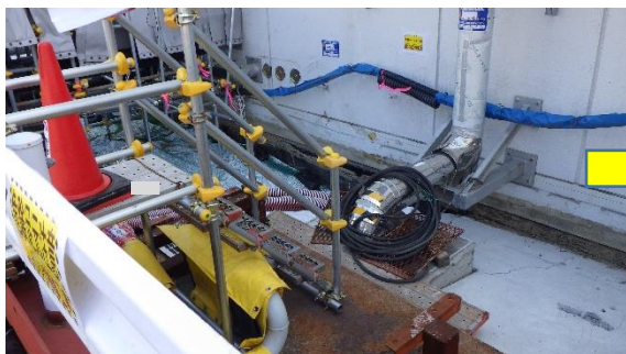
(写真4-1) サイトバンカ建屋西側陥没箇所 (令和3年5月10日撮影)