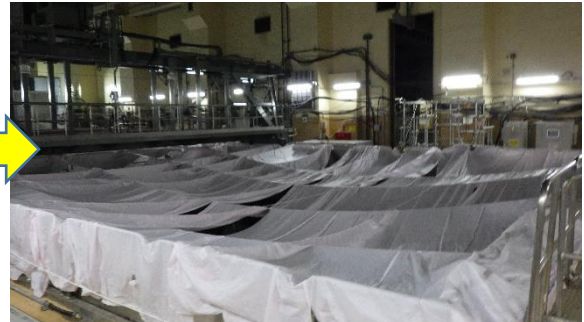
(写真1-2) 同左 (令和3年6月15日撮影)