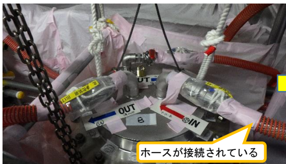
(写真2-1) 浄化フィルタ設置の状況 (令和3年3月16日撮影)