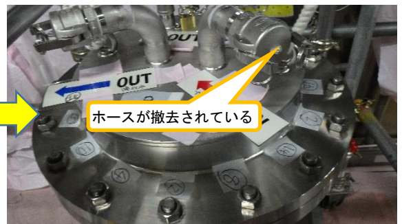
(写真2-2) 同左 (令和3年6月15日撮影)