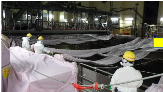
(写真1-1) サイトバンカ建屋2階貯蔵プールの 状況 (令和3年3月16日撮影)