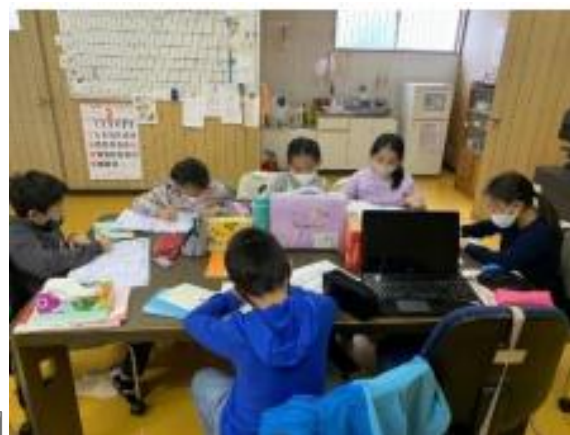
調べ学習に意欲的に生き生きと 取り組む子どもたちの様子