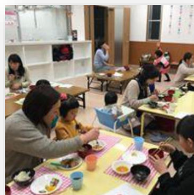
星総合病院こども食堂 「ほしくま☆みんなのキッチン」

https://www.pref.fukushima.lg.jp/sec/70210a/enterprise.html