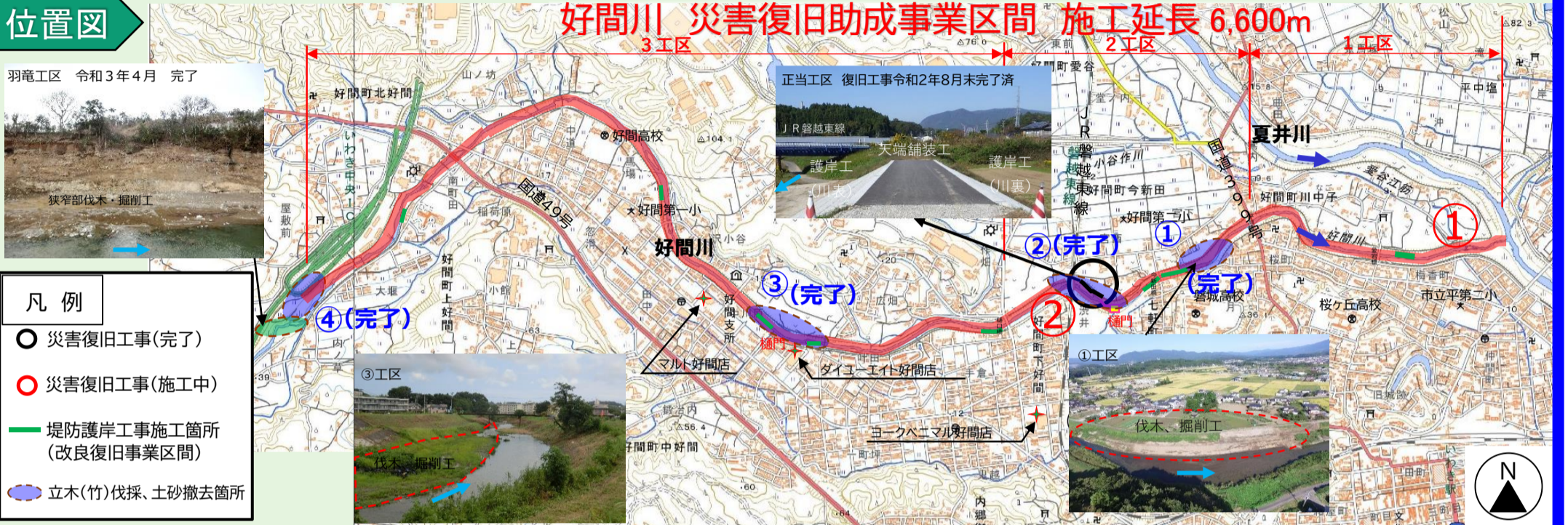
写真 好間川の改良復旧工事1, 2工区の掘削・護岸工を実施している箇所を掲載しています。