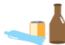
屋外に放置された空きビン・缶・ペットボトル