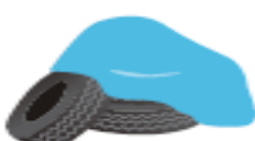
雨除けのブルーシートや古タイヤに溜まった水たまり