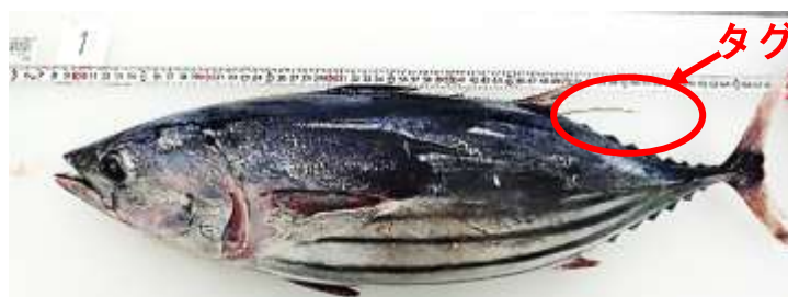
図2 再捕されたカツオ