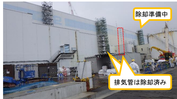
(写真1-2) 今回の状況 (令和4年2月10日撮影)