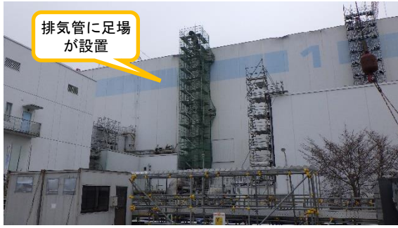
(写真 1 - 4) 排気管の除却準備状況 (写真 1 - 2 右側の排気管)