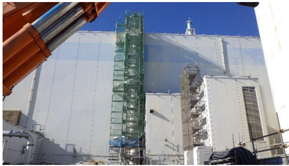
(写真 2 - 1) 前回、足場が設置されていた 4 号機 建屋の排気管の状況 (令和 3 年 12 月 15 日撮影)