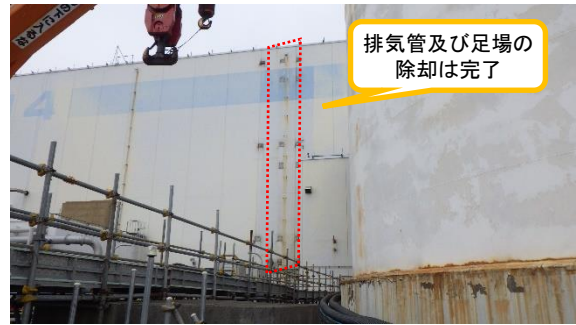
(写真 2 - 2) 今回の状況 (令和 4 年 2 月 10 日撮影)