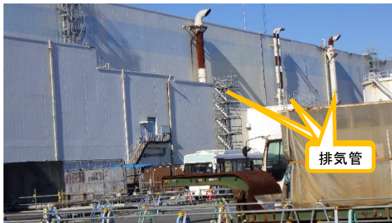
(写真1-1) 前回の1, 2号機建屋の排気管の設置状況 (令和3年12月15日撮影)