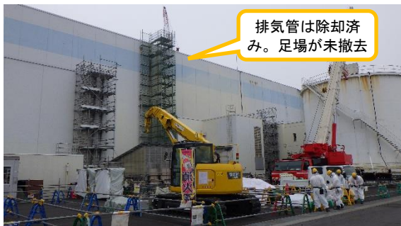
(写真1-3) 排気管の除却状況 (写真中央の足場は写真1-2中央の足場と同じもの)