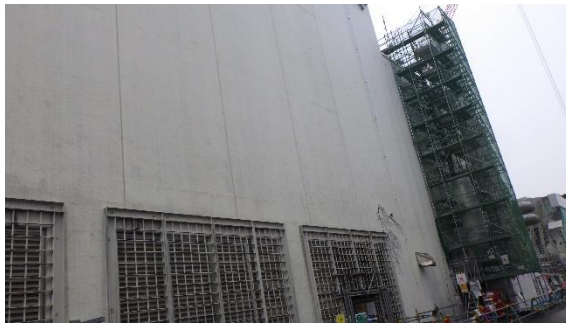
(写真 3 - 1) 3 号機建屋の排気管 (3 基目) の除 却状況