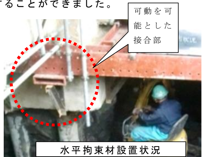
水平拘束材設置状況