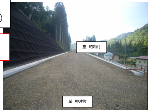
改良工 完了状況 (10月下旬)