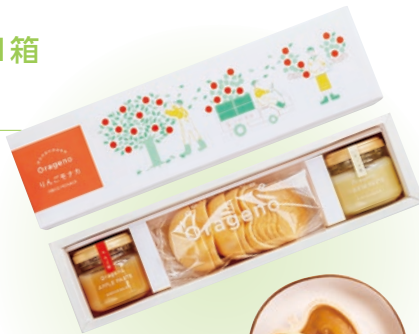
もなか種5組、りんご餡・ チーズ餡各70g1瓶

自社農園で土作りからこだわって栽培された、風味と果肉食感がしっかりとしたりんごを使った「りんご餡」。マスカルポーネチーズとクリームチーズを独自の配合で合わせたまるやかなコクと豊かな味わいの「チーズ餡」。2つの餡をお好みでぱりぱりのもなかに詰めて食べる、作る楽しみと食べる楽しみの2つを楽しめる、手土産や贈り物にもおすすめのスイーツです。