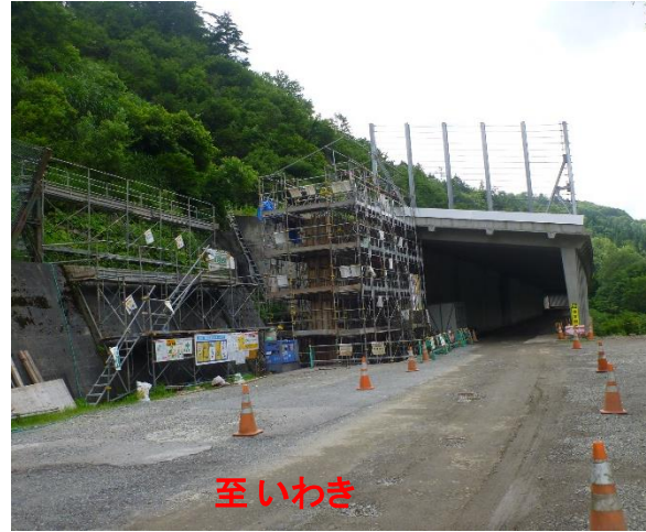
スノーシート工事状況