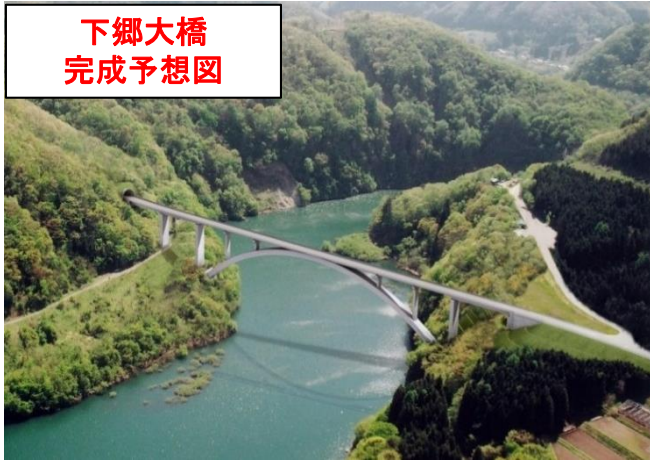
下郷大橋 完成予想図