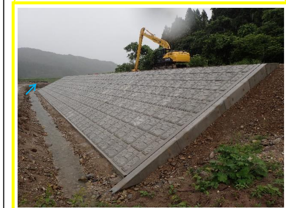
← 護岸施工状況 (令和3年6月末時点)