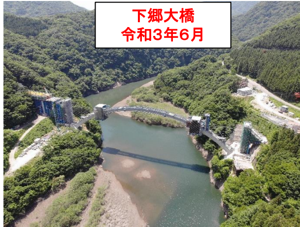
下郷大橋 令和3年6月