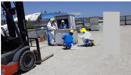
(写真2) コンテナの状況 (南側から撮影) ※漏えい箇所はコンテナ北側(写真奥側)の下部