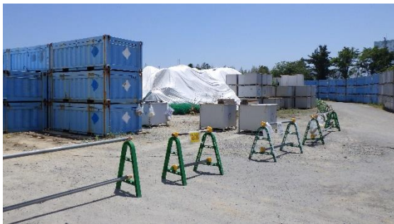
(写真1) 一時保管エリアE1入口付近の概観 (北西側から撮影)