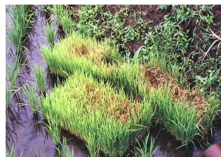
図2：置き苗から発生したいもち

会津での葉いもちの初発は6月下旬です。移植時の箱処理剤や散布剤等で適切に防除しましょう。また、感染源となる補植用置き苗は早急に処分しましょう(埋却する等)。