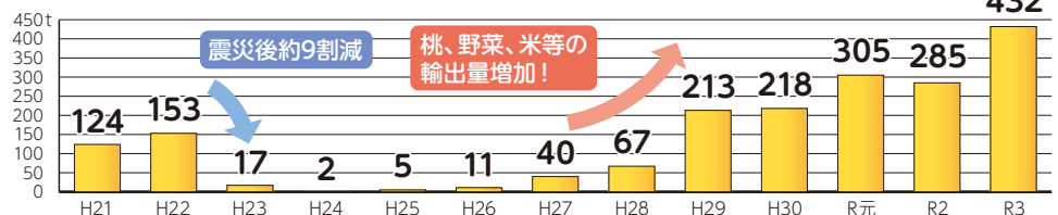
福島県農産物の輸出量の推移（令和4年3月31日現在）

県産農産物の輸出状況は、令和3年度には、震災前と比較すると約2.8倍となり、過去最高の輸出量となりました。