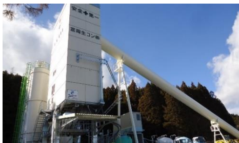
富岡生コン株式会社（富岡町）