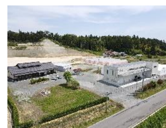
株式会社アグリ鶴谷(南相馬市)