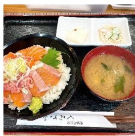
海鮮和食処くろさか（浪江町）