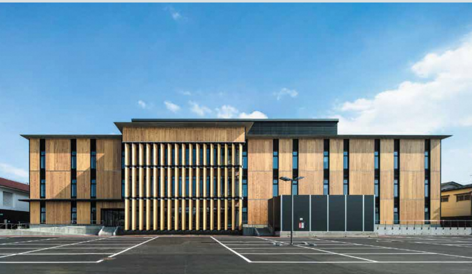
◆第37回建築文化賞 準賞 スマートシティAiCT…会津若松市