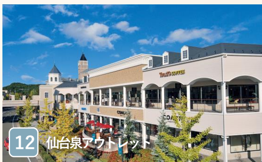
12 仙台泉アウトレット