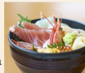
福島の美味しい魚 (イメージ)