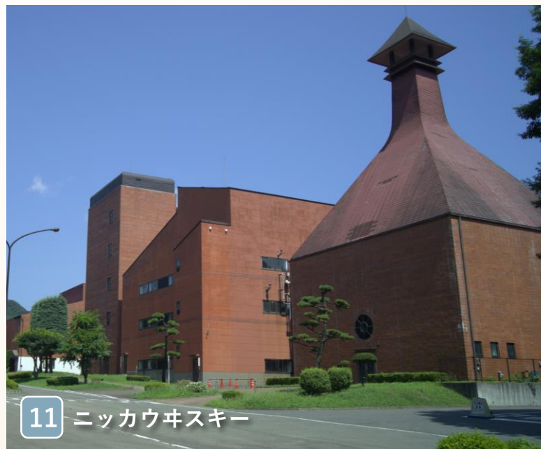
11 ニッカウキスキー