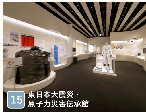
15 東日本大震災・ 原子力災害伝承館