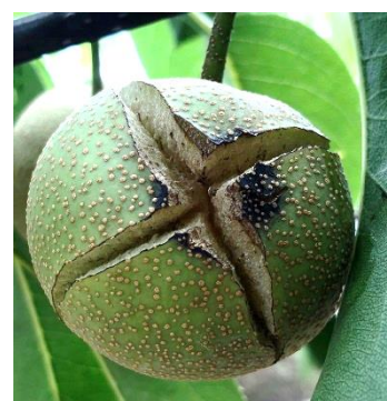
写真1 ナシ黒星病 発病果実

● 情報内容への質問は、福島県農業総合センター安全農業推進部発生予察課（病害虫防除所）まで御連絡ください。本情報は、病害虫防除所ホームページ ( https://www.pref.fukushima.lg.jp/sec/37200b/ )でもご覧になれます。