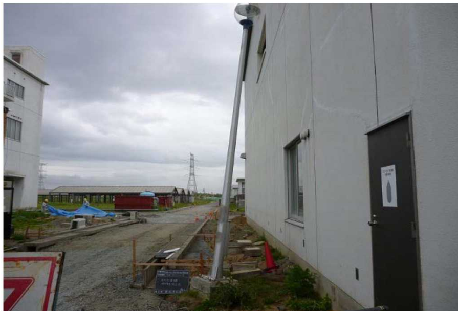
写真1-1 舗装、街灯損傷状況