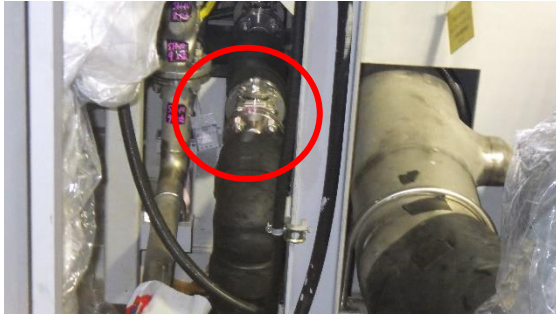
(写真2) 漏えい箇所の状況（西側から撮影）