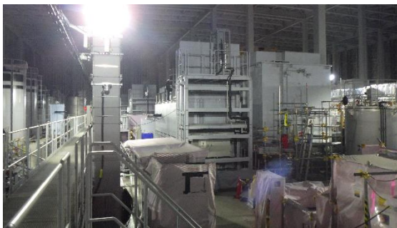
(写真1-1) 増設多核種除去設備建屋内の状況 (北西側から撮影)