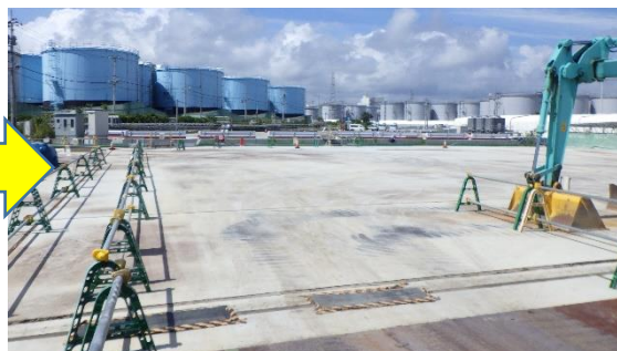
(写真5-2) 旧Cタンクエリア東側隣接地の状況 （今回(令和4年9月12日)東側から撮影）