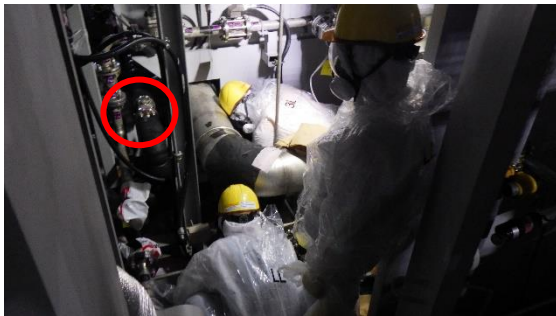
(写真3) 東京電力担当者の現場確認の状況 （西側から撮影）