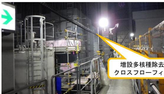
(写真1-2) 増設多核種除去設備(C) クロスフ ローフィルタスキッドの概観 (西側から撮影)