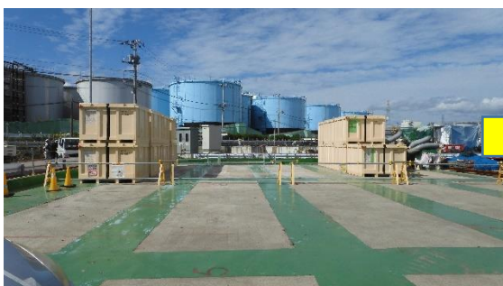
(写真5-1) 旧Cタンクエリア東側隣接地の状況 （前回(令和2年10月7日)東側から撮影）