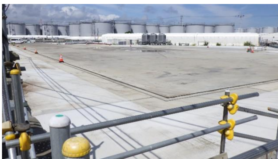
(写真4-1) 旧Cタンクエリアのコンクリート基礎構築状況①（南東側から撮影）