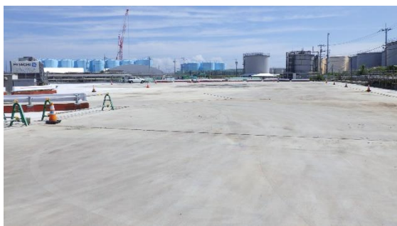
(写真4-2) 旧Cタンクエリアのコンクリート基礎構築状況②（北西側から撮影）