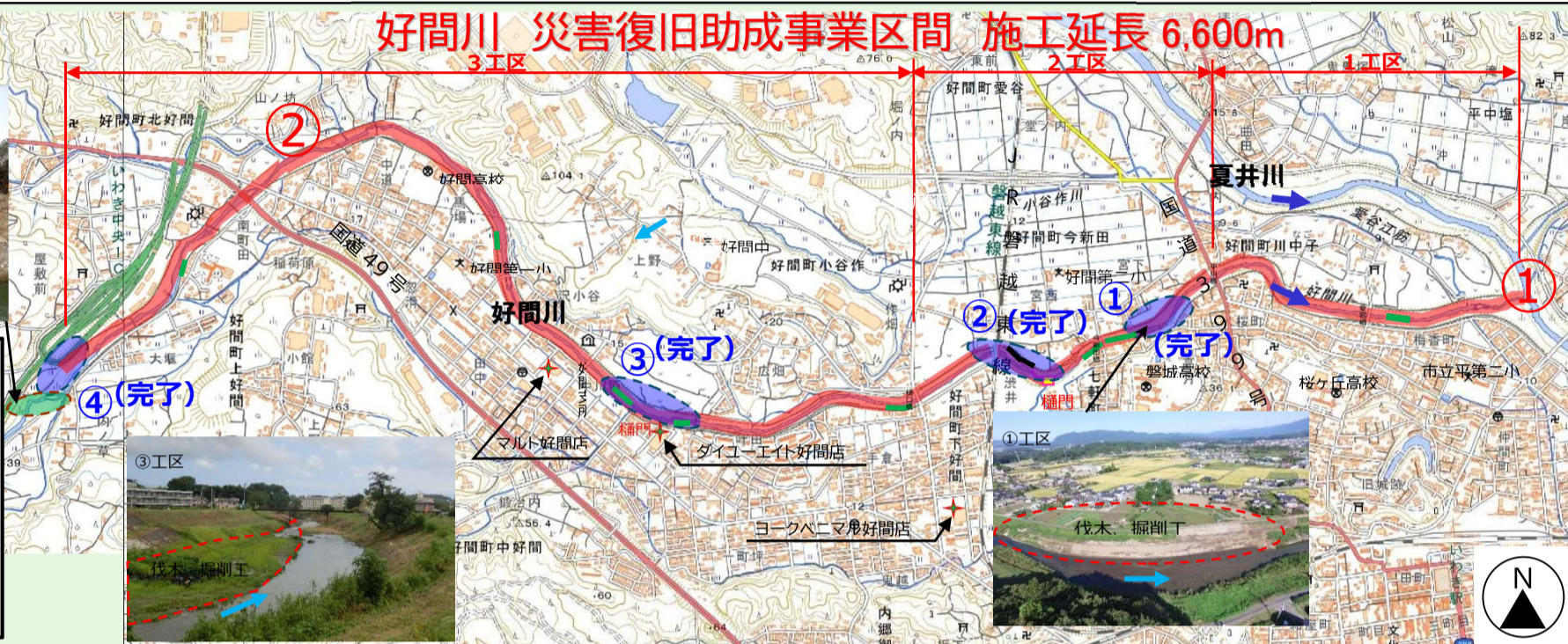
写真 好間川の改良復旧工事1, 3工区の本格的な河道掘削を実施している箇所を掲載しています。