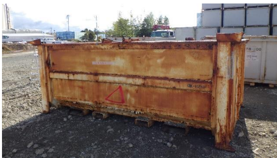
(写真2) 外観検査を実施していたコンテナ