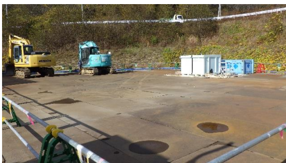
(写真4) コンテナから別のコンテナへの廃棄物の詰替え作業エリア