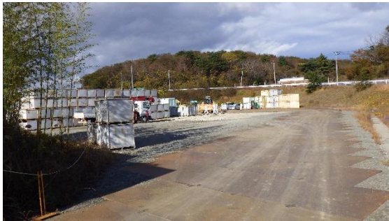
(写真1) 瓦礫類一時保管エリアF 2北側の概観（入口付近）