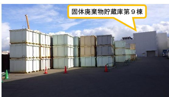
（写真5） 仮設集積場所（固体廃棄物貯蔵庫第9棟の敷地入口付近から撮影）