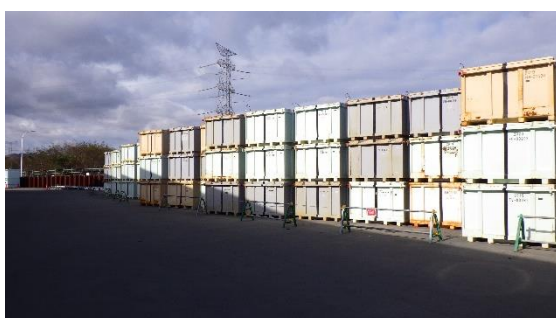
（写真6） 仮設集積場所（固体廃棄物貯蔵庫第9棟の敷地入口付近に向かって撮影）