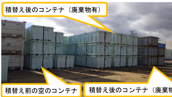
(写真3) 仮置きされていたコンテナ