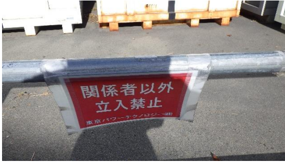
(写真7) 関係者以外立入禁止の標示