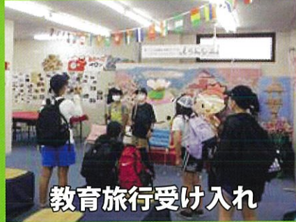
教育旅行受け入れ