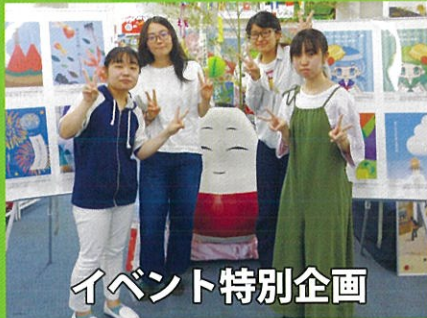
イベント特別企画