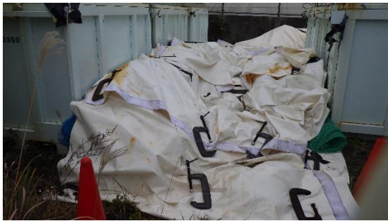
(写真2-2) 一時保管エリア n の状況