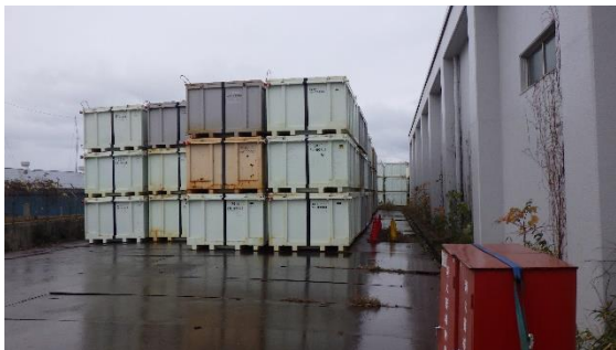
(写真2-3) 一時保管エリア n の状況 (北部分を西側から撮影)