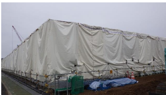
(写真1-3) 一時保管エリアXの状況③ (北東側から撮影)