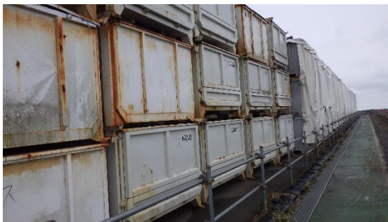
(写真1-2) 一時保管エリアXの状況② (南東側から撮影)