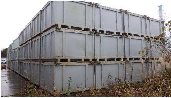
(写真2-1) 一時保管エリア n の状況 (南西側から撮影)