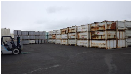
(写真1-1) 一時保管エリアXの状況① (南西側から撮影)