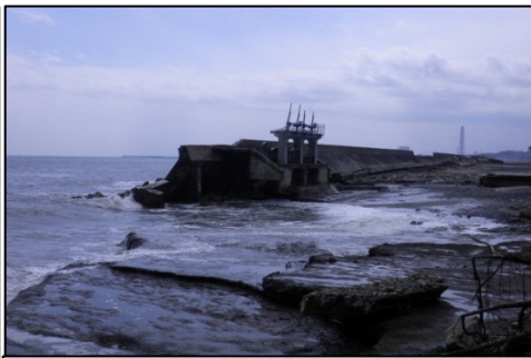
南海老海岸(南相馬市)被災状況