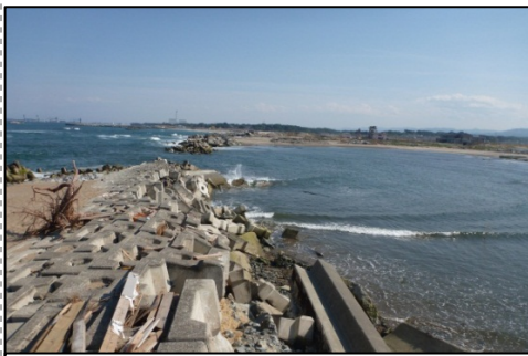
木崎海岸(新地町)被災状況

現在、右図に示す7海岸について堤防(本体)工事の入札手続きを進めており、まもなく工事に着手する予定(11月臨時議会承認後)です。工事着手後は相双地方の海岸堤防の早急なる完成を目指し鋭意事業を実施してまいります。