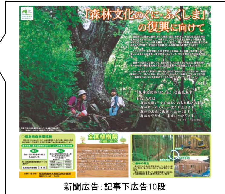
新聞広告：記事下広告10段