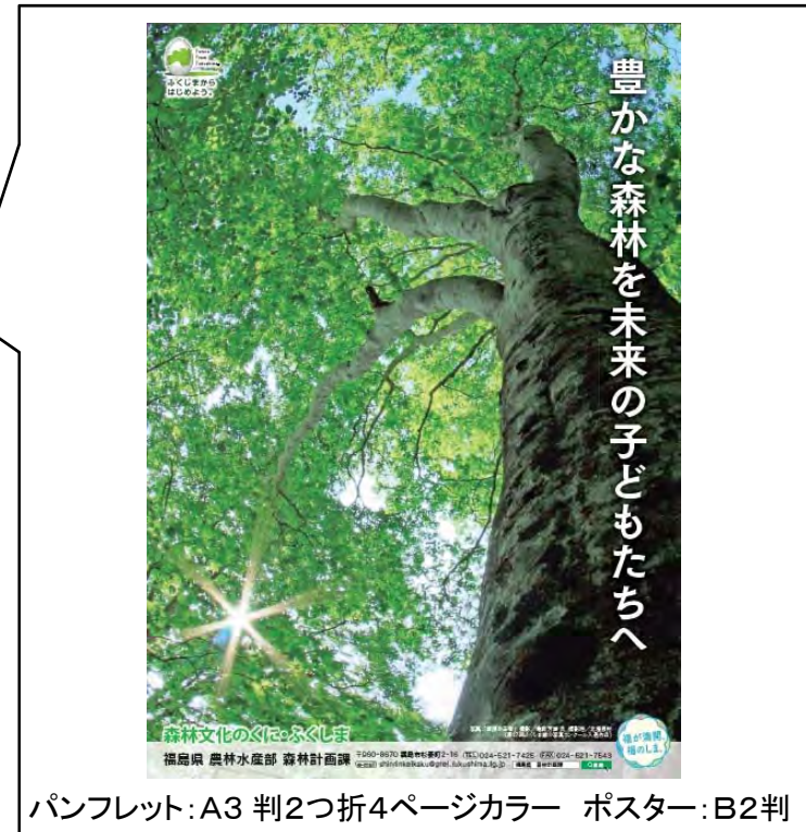
パンフレット：A3 判2つ折4ページカラー ポスター：B2判