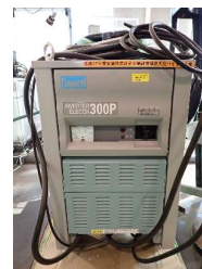
TIG溶接機 (インバータエレコン300P) (480円/時間)