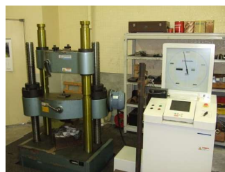
万能試験機 (UH-F1000kNX) (5,140円/時間)