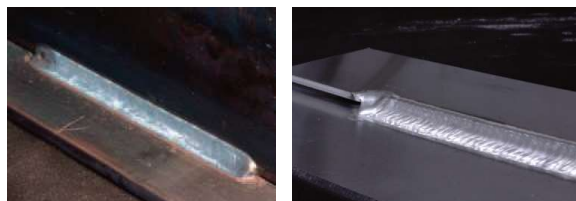
<実験例1> 左：軟鋼、右：アルミニウム合金