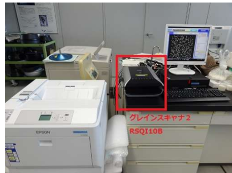
グレインスキャナー2 RSQI10B