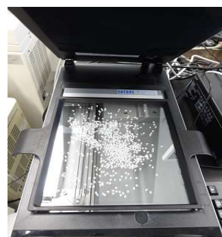
酒造原料米分析の様子