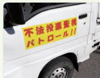
車両による監視パトロール活動