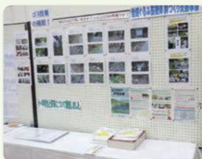
地域文化祭で啓発活動

不法投棄防止啓発、監視パトロール、地域環境整備活動事業(地域内における廃棄物の片付け等)を行う地域住民団体の活動に対し、最大70万円まで補助金を支給する事業を行っています。詳細は最寄りの各地方振興局までお問い合わせください。