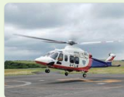
スカイパトロール