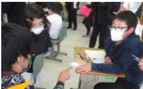
測った辺の長さや角の大きさについて話し合う子どもたち