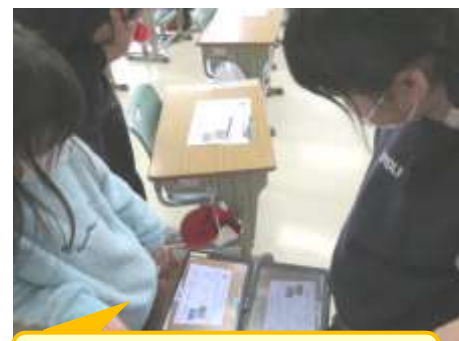
考えを交流し、解決方法を紹介し合う子どもたち