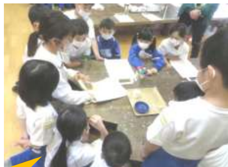
エコバッグの染め出し方法について熱心に説明を聞く子どもたち