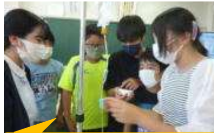
看護師に点滴の仕方について意欲的に質問する子どもたち