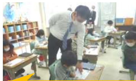
交流後にこれから自分が頑張ることを書く子どもたち

○ 各自が考えたきれいにするための方法を話し合った。自分と同じところ、違うところを意識して交流し合うことで、友達の様々な考えに気付くことができた。