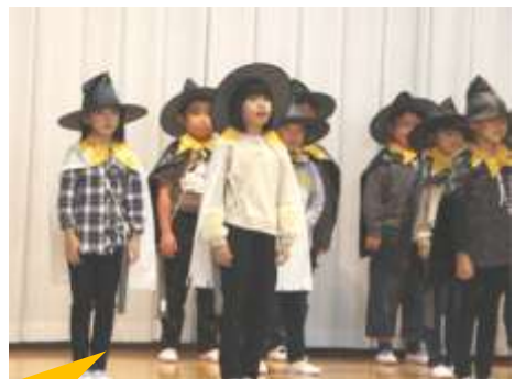
学習発表会の音楽劇で元気に自分を表現する子どもたち

○ アンケートを実施したところ、基礎的汎用的能力の4つの身に付けたい力の中で「課題対応能力」と「キャリアプランニング能力」に課題があることが分かった。これらの実態から、特に身に付けたい力を「他者と協力して、物事を進めていく力」、「将来とのつながりを考える力」と設定し、全職員が意識しながら全ての教育活動を進めてきた。