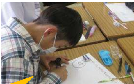
グループで話し合った内容を発表用シートにまとめる子ども