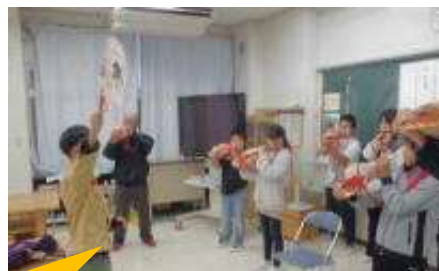
講師の先生と一緒に演目「集合」を演奏する子どもたち