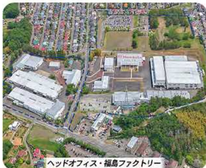
ヘッドオフィス・福島ファクトリー

ムネカタグループの広大な敷地の中には、11棟の建屋と2つの巨大倉庫があり、ワンストップのモノ創りや研究開発が行われています。社員駐車場も完備され、働く環境はバッチリです。