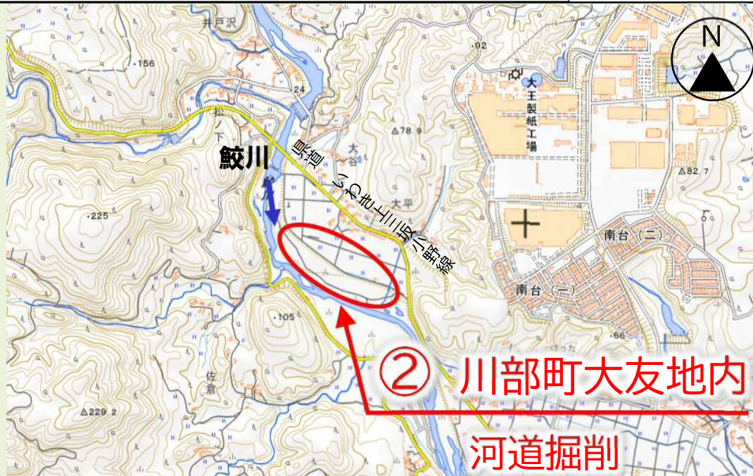
写真 鮫川の災害復旧や河道掘削等の工事状況について代表的な箇所を掲載しています。