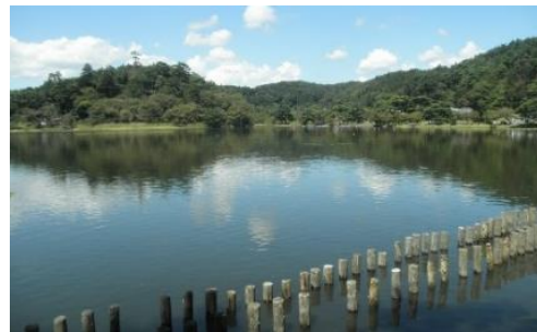
現在の南湖の風景

『奥州白川南湖真景』乾, 小沢皆園 写, 明治 17. 国立国会図書館デジタルコレクション https://dl.ndl.go.jp/pid/9369913 (参照 2023-03-29) を加工して作成