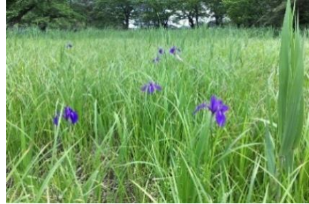
南湖公園内の湿地に生育する絶滅危惧種カキツバタ

南湖公園は、年間 40 万人以上が訪れる、県南地方有数の観光地です ※1 。寛政の改革を行ったことで知られる白河藩主・松平定信は、1801（享和元）年に湿地だった場所の土砂等を掘りあげ、堤を作り、今の南湖を作りました。門や柵もなく開放的な園地が広がる南湖公園は、日本最古級の公園としても知られ ※2,3 、国の史跡・名勝に指定されています。歴史まちづくり法による歴史的風致維持向上地区計画が導入され、外観や屋根の構造に関するきめ細かいルールに従ったデザインの店舗群が並び、平日昼間でも観光客や市民で賑わっています。また、元々の自然や地形を活かして造園されたため、湿地や池の岸にカキツバタ、水中にトリゲモなど、絶滅危惧種が豊富に生育する生物多様性保全上重要な場所 ※4 、県立自然公園にも指定されています。