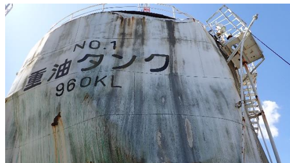
(写真 2 - 2) No. 1 重油タンクの状況 (北西側から撮影) (今回撮影：令和 5 年 3 月 20 日)