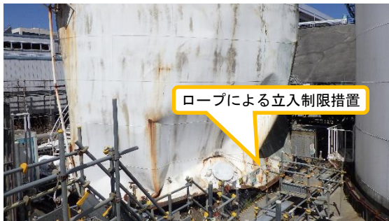
(写真 1) No. 1 重油タンクの状況 (南東側から撮影)