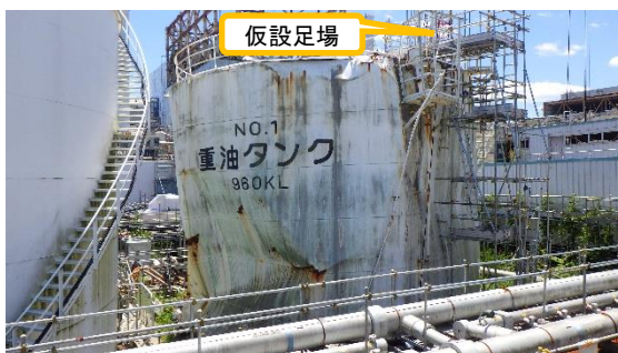
(写真 2 - 1) No. 1 重油タンクの状況 (北西側から撮影) (前回撮影：令和 4 年 7 月 1 日)