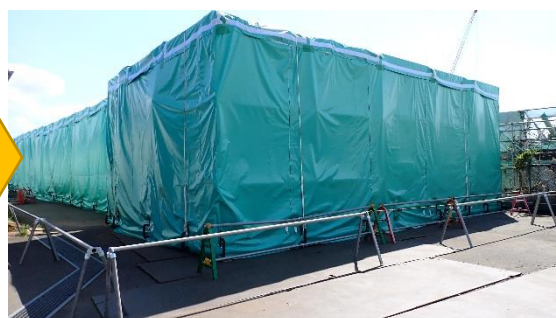
(写真1-2) 第1棟南側の状況 (北西側から撮影) (令和5年4月3日撮影)