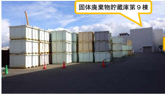
(写真2-1) 第9棟北側の状況 (令和4年12月2日撮影)