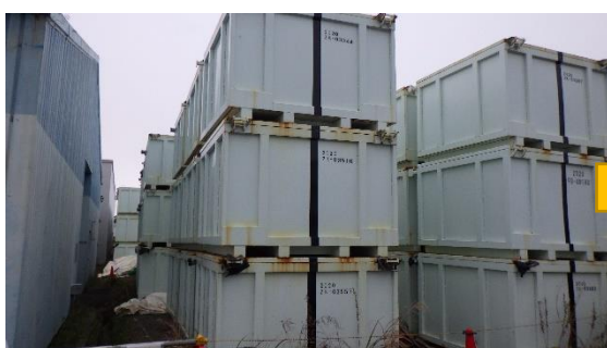
(写真1-3) 一時保管エリアnの状況 (令和4年12月1日撮影)