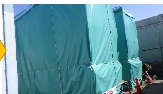
(写真1-4) 一時保管エリアnの状況 (令和5年4月3日撮影)