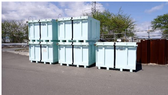
(写真3-1) 第9棟北側におけるコンテナ仮置き 状況