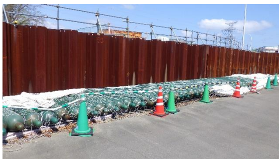
(写真3-3) 第9棟北側におけるポンベの仮置き 状況