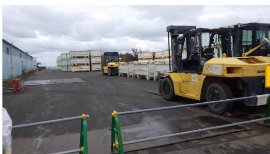
(写真1-1) 第1棟南側の状況 (北西側から撮影) (令和4年12月1日撮影)