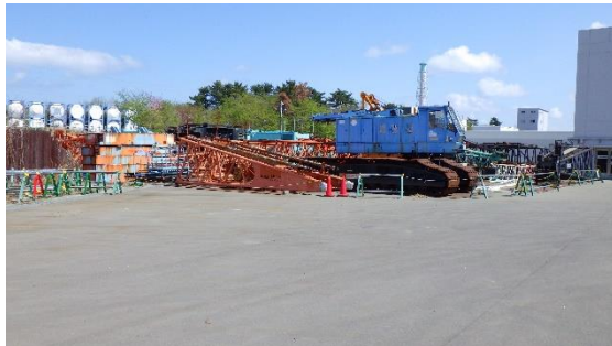
(写真3-2) 第9棟北側におけるクレーン等の仮 置き状況