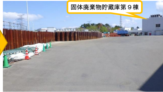
(写真2-2) 第9棟北側の状況 (令和5年4月3日撮影)