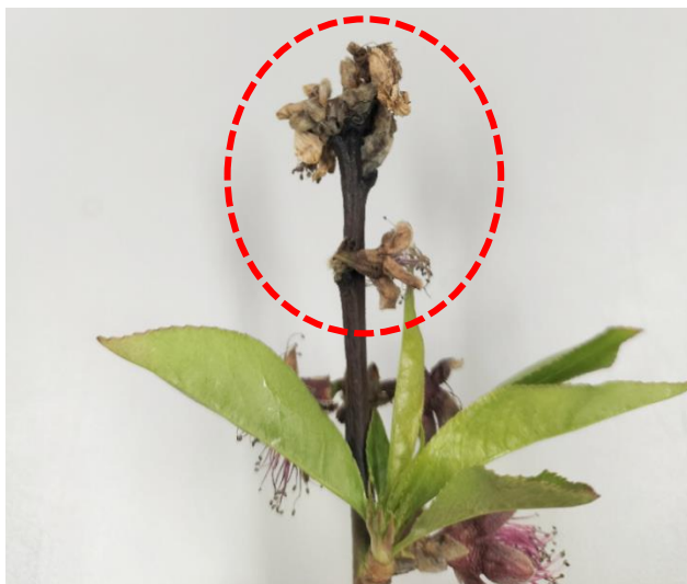
図2 春型枝病斑の発生（新梢葉の生育不良と枝の変色、令和5年4月17日撮影）