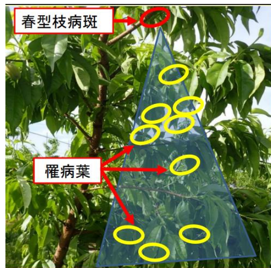
図3 春型枝病斑が樹冠上部に発生した場合の発病状況