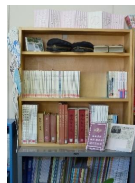
「福高の歩み」コーナー 金線の入った学帽も展示