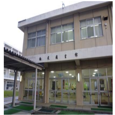
梅苑図書館（別棟2階）