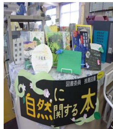
「自然に関する本」と手作り POP