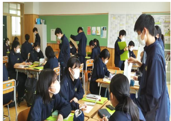
1学年「本の紹介」活動