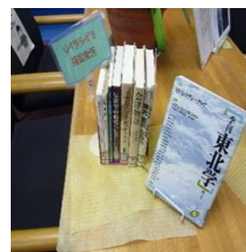
赤坂先生の関連図書