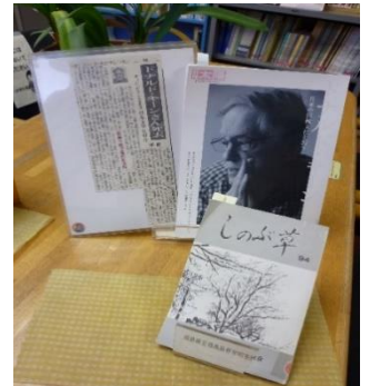
↑特集のドナルド・キーン氏 （本校元教員の角田柳作先生の 大学での教え子）