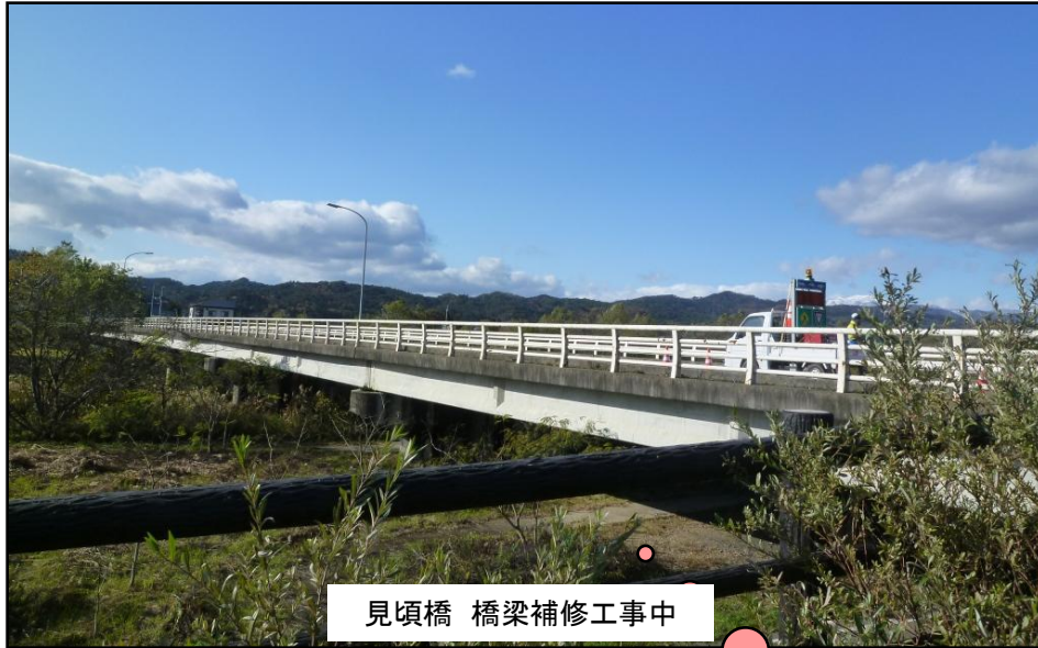
見頃橋 橋梁補修工事中