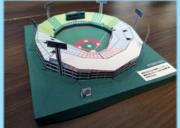
ペーパークラフト作り