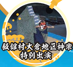
飯館村大倉地区神楽 特別出演