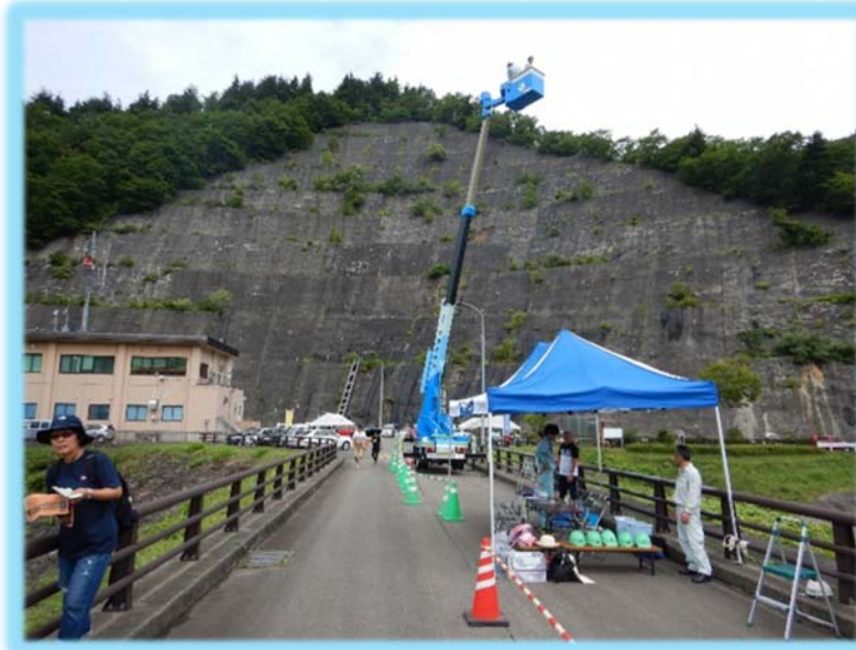
リフト車乗車体験