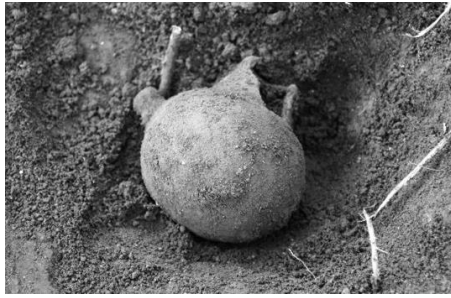
縄文時代晩期注口土器