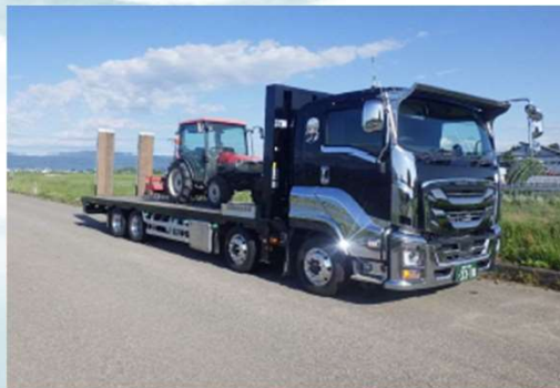
写真：貨物運送状況