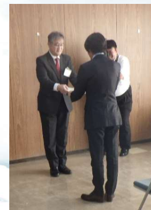
認定証書を受ける庄司代表取締役社長（右）