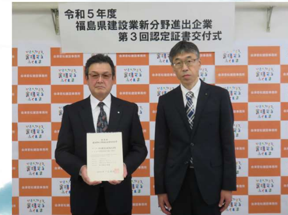
認定証書を受ける小柴代表取締役(左)