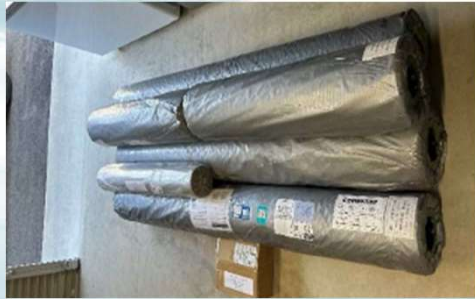
写真：人工芝納品状況

交付月日：令和5年11月16日（木） 交付場所：福島県庁 北庁舎6階入札室 事業内容：人工芝の販売