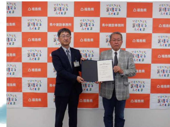
認定証書を受ける三瓶代表取締役(右)