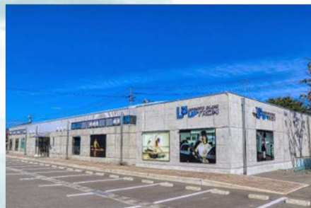
写真：フィットネスジム外観

交付月日：令和5年11月8日（水） 交付場所：福島県南相馬合同庁舎 4階403南会議室 事業内容：フィットネスジムの経営