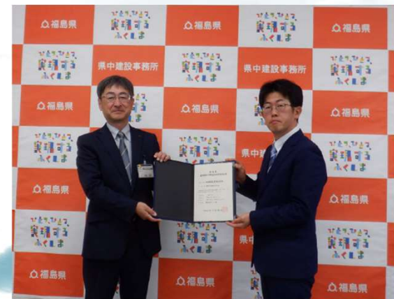
認定証書を受ける松本代表取締役（右）