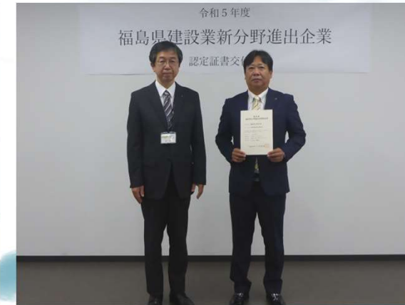
認定証書を受ける来次代表取締役（右）