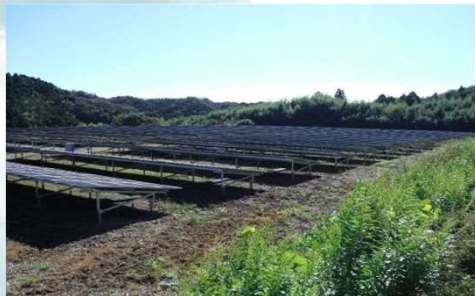
写真：太陽光発電敷地内除草

交付月日：令和5年11月10日（金） 交付場所：福島県郡山合同庁舎 北分庁舎2階会議室 事業内容：太陽光発電敷地内除草