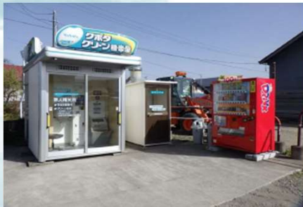
写真：コイン精米所全景

交付月日：令和5年11月13日（月） 交付場所：福島県会津若松合同庁舎 本館3階地域連携室 事業内容：コイン精米所の経営