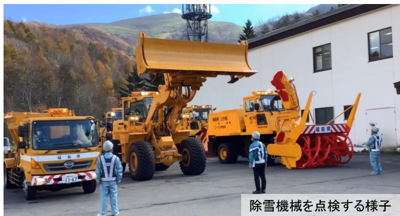
除雪機械を点検する様子

このため、除雪車が作業を止め路肩に寄るまでは、車間距離を確保しながら追従走行するよう御協力ください。