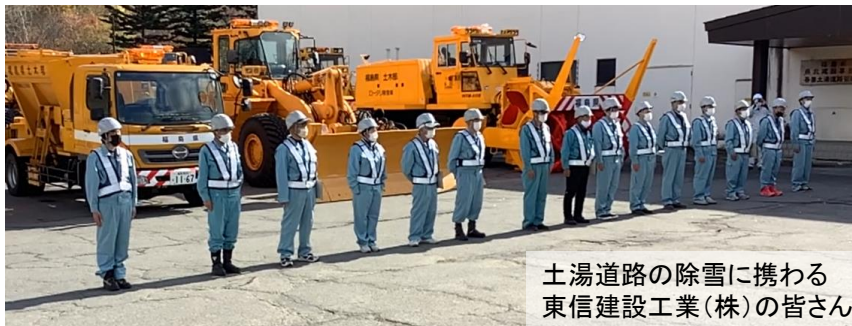
土湯道路の除雪に携わる東信建設工業(株)の皆さん

除雪機械出動式に先立ち、式の出席者全員で、除雪作業の安全と冬期間の無事故を祈願しました。