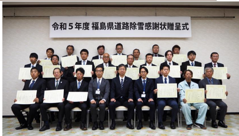
感謝状を贈呈された皆さん（前列中央は県北建設事務所長、両隣は保原及び二本松土木事務所長）

皆さまには、夜間休日を問わず、長い間、除雪業務に従事され、冬の地域住民の安全・安心を支えていただき、深く感謝申し上げます。また、今後とも、よろしくお願いいたします。