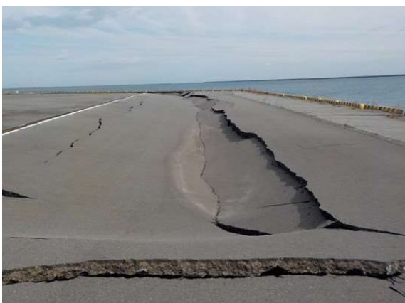
3号ふ頭護岸 復旧前