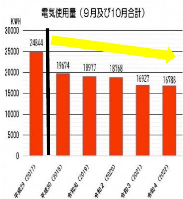
南会津高校（旧田島高校）の成果