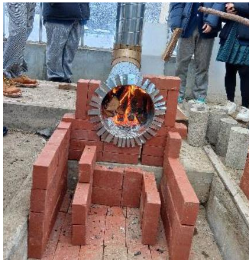
間伐材を燃料とした生徒自作の温室暖房器具

◎学校の活動を保護者や地域に周知し、地域にも取組を広げている活動が特に評価された。