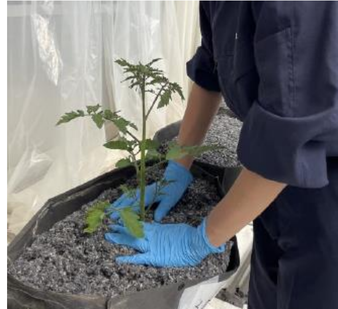
相馬農業高校の取組の様子