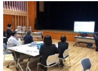
個人ワークによる講座企画書を発表する様子