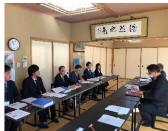
アフターコロナの公民館の役割を協議する様子