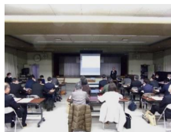
地域学校協働本部事業について協議する様子